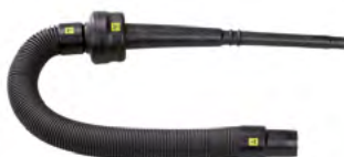
Flexible de 70 à 200 cm