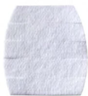
Filtre HEPA électrostatique PH-726