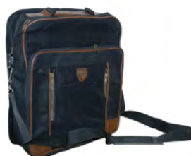
Sac de transport PH-709