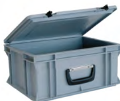
Petite caisse Dim : H 154 x L 400 x P 300 mm