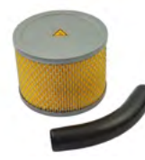
PH-704 avec ou sans adaptateur