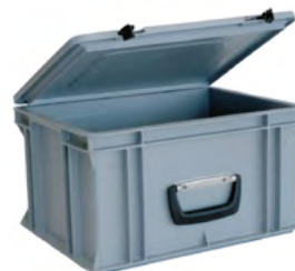
Grande caisse Dim : H 221 x L 400 x P 300 mm