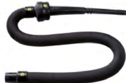
Flexible de 105 à 380 cm