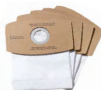
Sac à poussière, lot de 5 PH-722